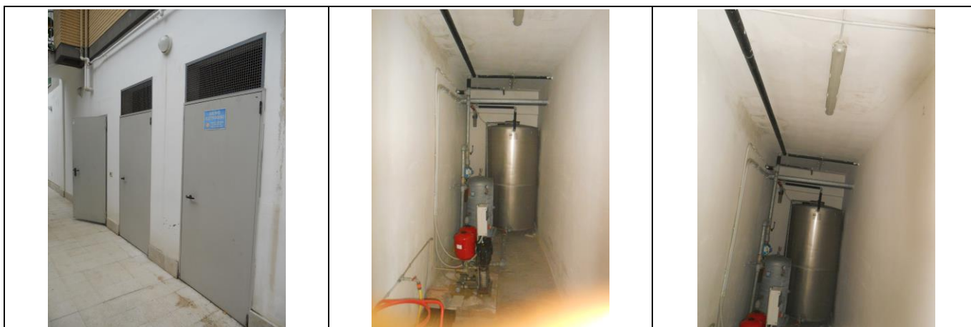
FOTO DA N. 1 A N. 3