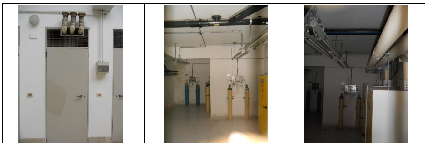
FOTO DA N. 1 A N. 3