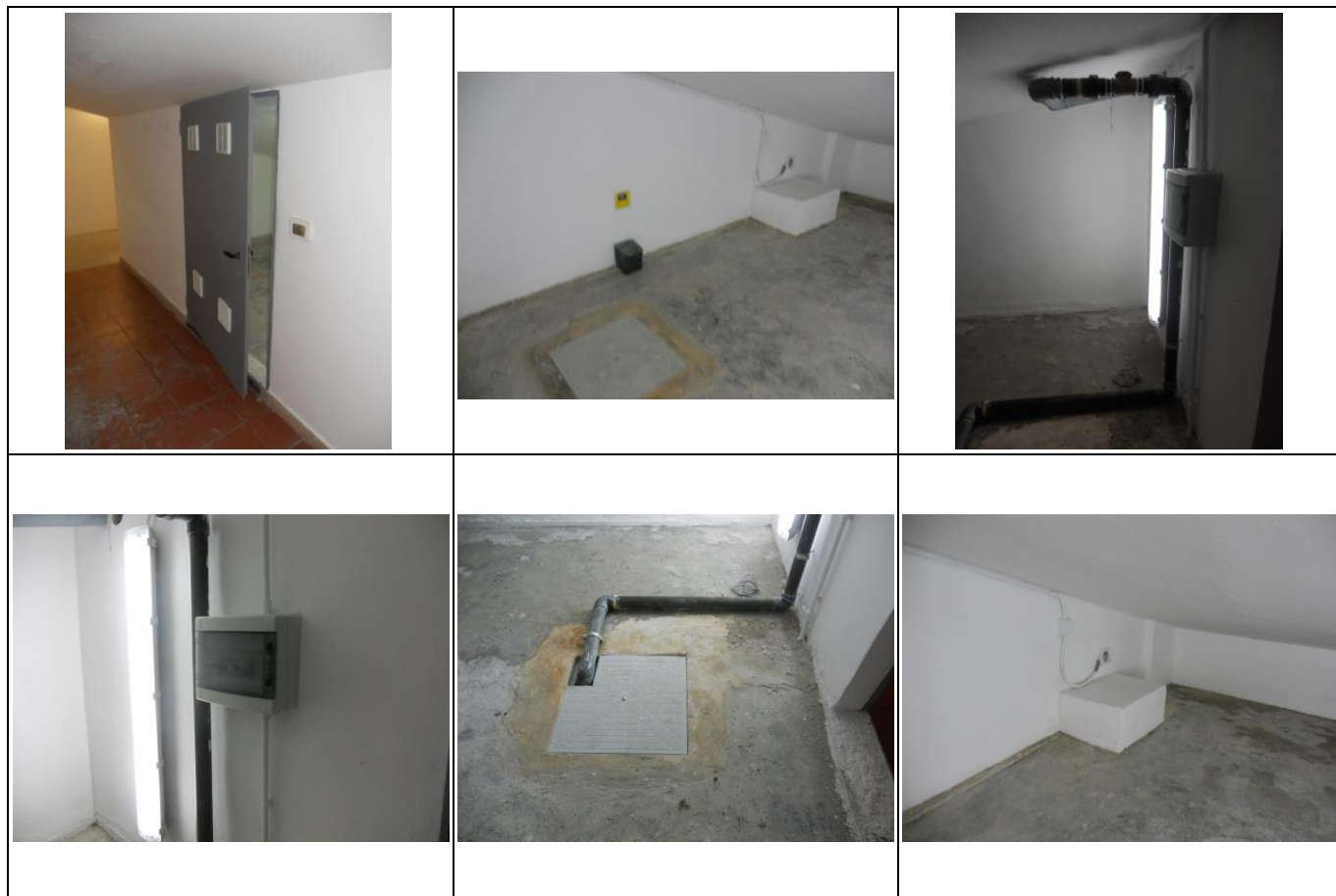
FOTO DA N. 1 A N. 6