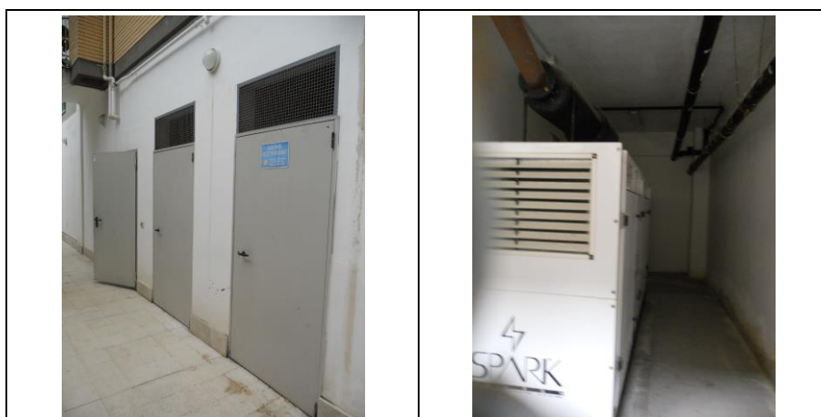
FOTO DA N. 1 A N. 2