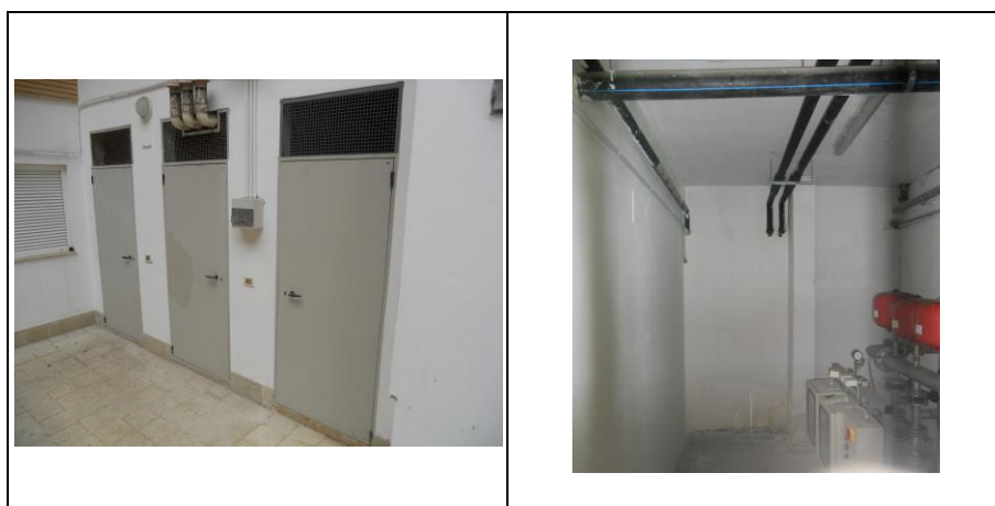
FOTO DA N. 1 A N. 2