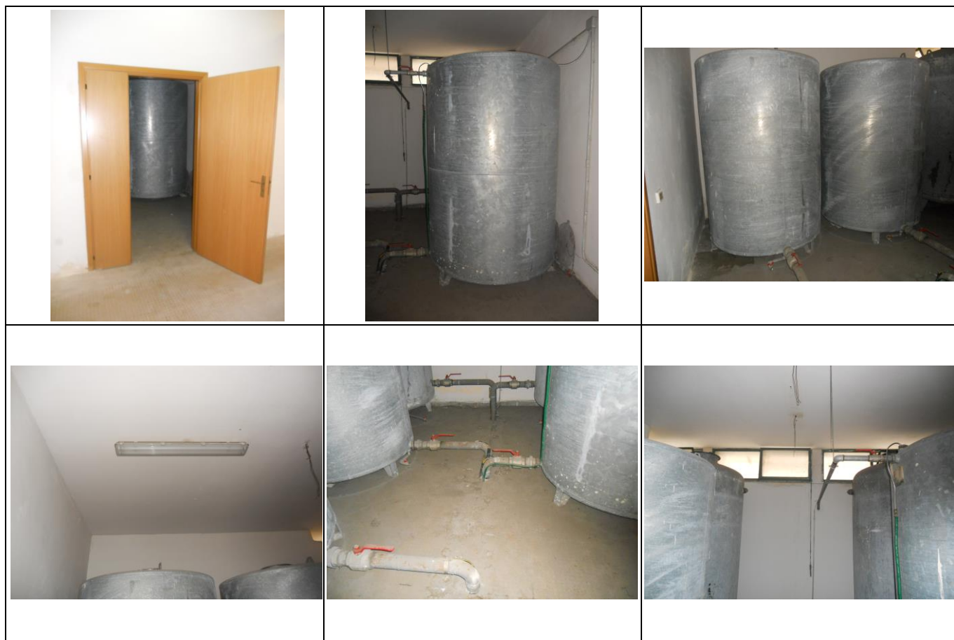
FOTO DA N. 1 A N. 6