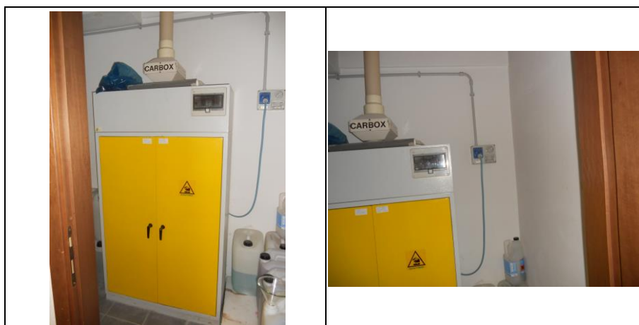
FOTO DA N. 1 A N. 2