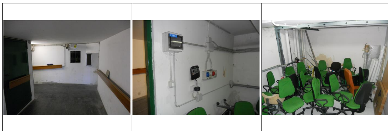
FOTO DA N. 1 A N. 3