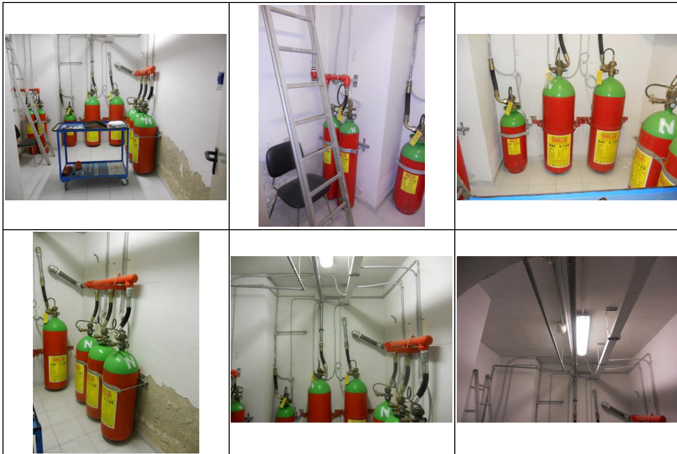
FOTO DA N. 1 A N. 6