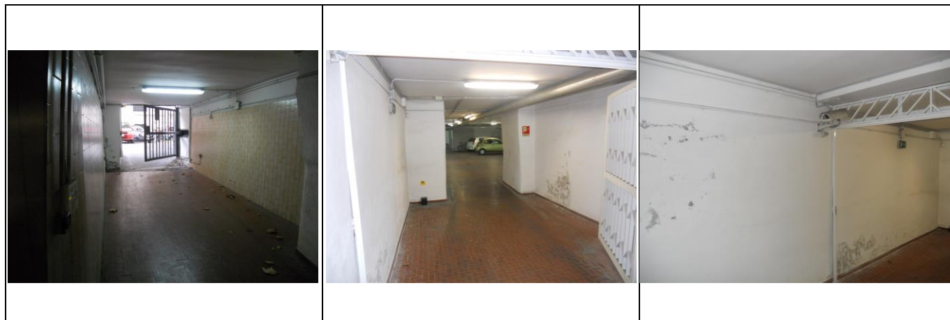
FOTO USCITA PIAZZA EROI DEL MARE EST