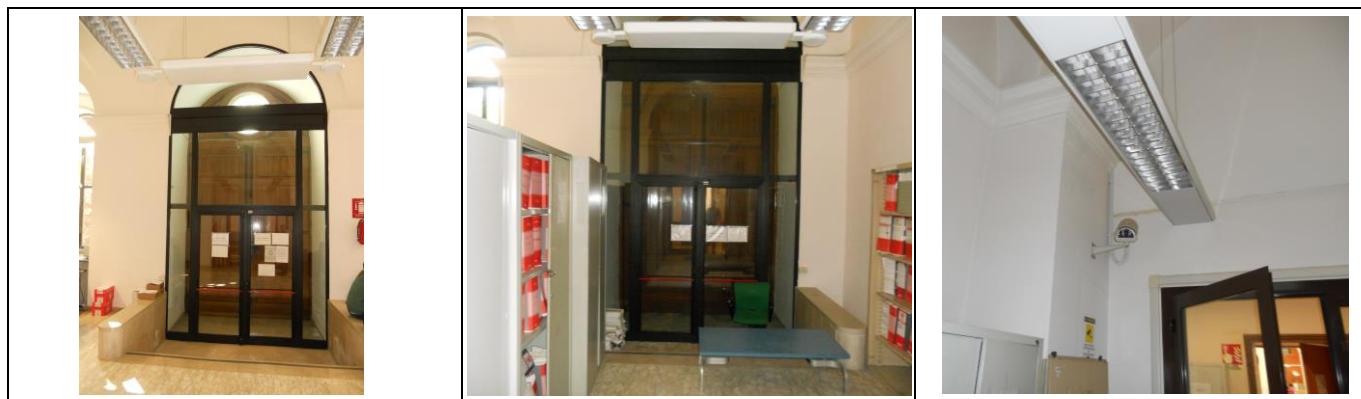
FOTO DA N. 1 A N. 3